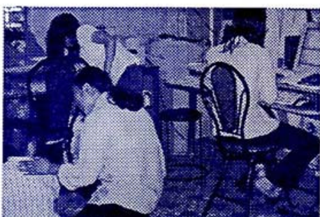
Những hình ảnh của các em nghèo và khuyết tật đang được huấn luyện và giúp đỡ