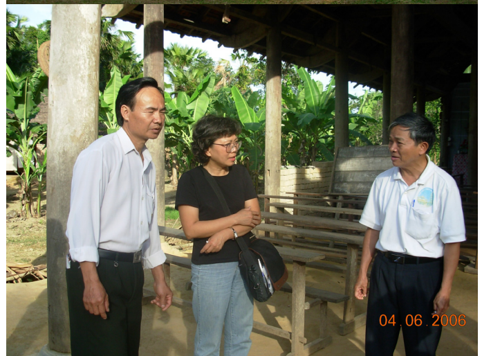
Trường ở Văn Đạm, rặng núi Trường Sơn