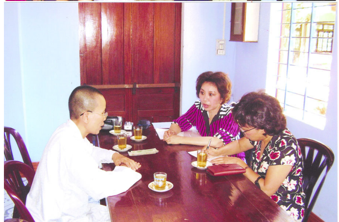
Thăm chùa Diệu Nghiêm