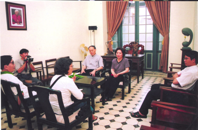
Yết kiến ĐTGM Ngô Quang Kiệt, Tổng Giáo Phận Hà Nội