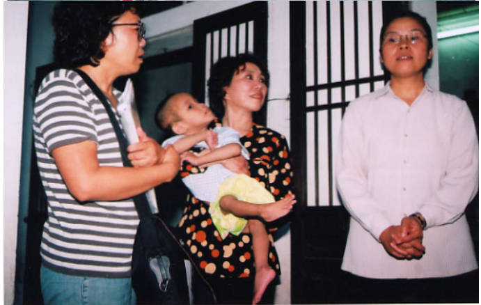
Trung tâm Nhà Tình Thương Thánh Giuse, Văn Giáo