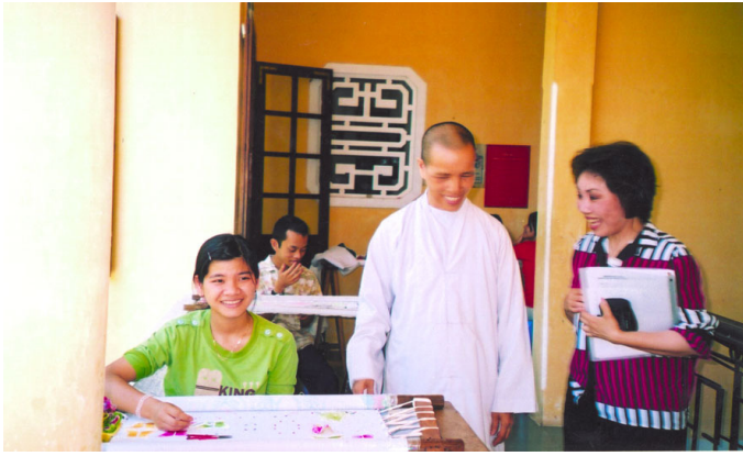
Thăm học sinh câm điếc tại chùa Tây Linh