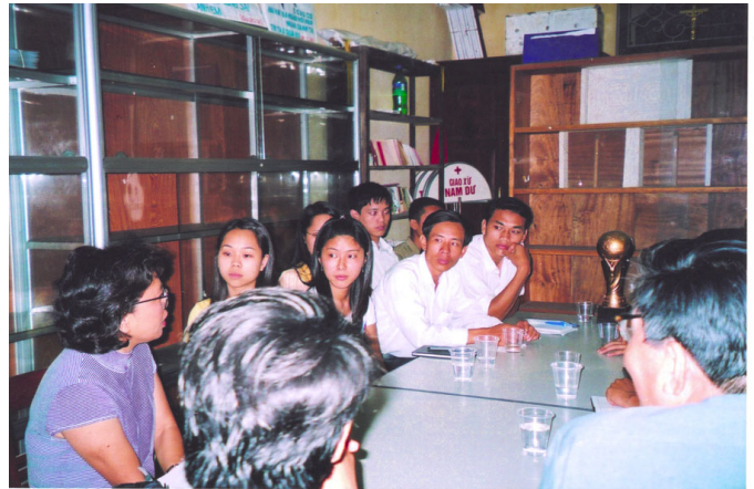
Gặp gỡ Sinh Viên tại Hà Nội