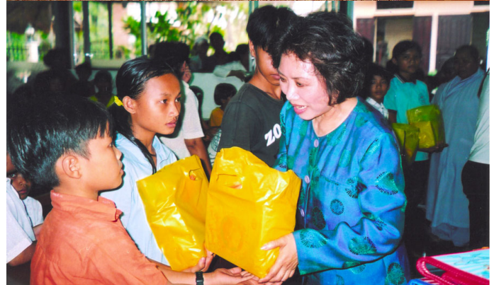
Thăm chùa Tịnh Nghiêm

với quà trong tay, lòng chúng tôi cũng rộn ràng với niềm vui của các em.