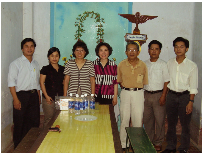
Nhóm Giáo Viên thiện nguyện

Tại Huế chúng tôi cũng được gặp nhóm giáo viên tình nguyện đi về vùng quê để dạy các em học . Chúng tôi rất cảm phục nghĩa cử cao đẹp của họ. Miền Trung rất nghèo cuộc sống thật khó khăn nhưng họ vẫn bỏ tiền túi mua xăng nhớt để đi về thôn quê dạy các em. Chúng tôi nói với họ rằng Hội EFTP chúng tôi sẽ hết lòng hỗ trợ công việc mà họ đang thực hiện, vì đây cũng là mục đích của hội