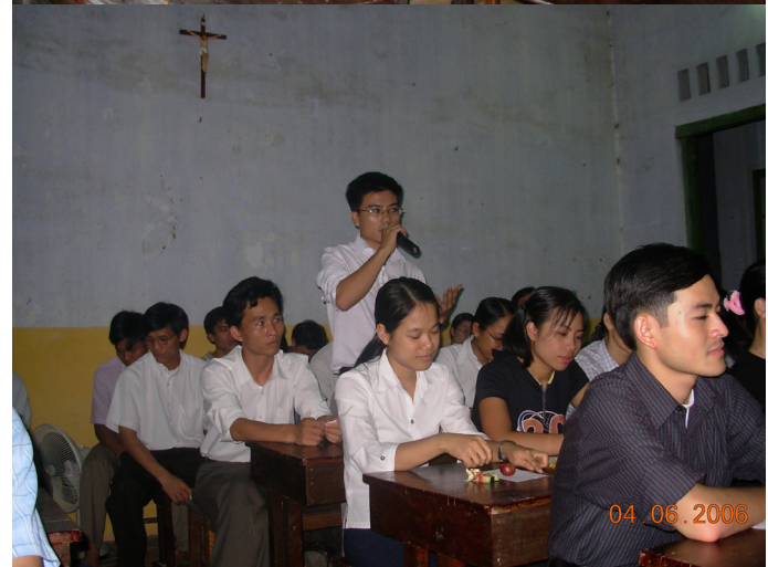
Gặp gỡ Sinh Viên tại Huế