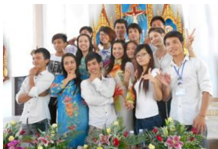
TNV cùng anh em BDH khóa học anh ngữ hè 2012 tại GXTV

Dư âm của một mùa hè đầy ý nghĩa còn vang vọng trong lòng mỗi người giáo dân trong giáo xứ, đặc biệt là các em học sinh sau khóa học Anh Văn mùa hè năm 2012 tại giáo xứ Tiếp Võ. Thì giờ đây, niềm vui nối tiếp niềm vui, ân tình nối tiếp ân tình, khi giới trẻ giáo xứ lại được nhận thêm những món quà đặc biệt, không chỉ về giá trị vật chất lớn, mà còn gói ghém nhiều tình cảm sâu xa qua từ nửa vòng Trái Đất đến với Việt Nam và dừng chân tại giáo xứ Tiếp Võ, thuộc thị xã Hồng