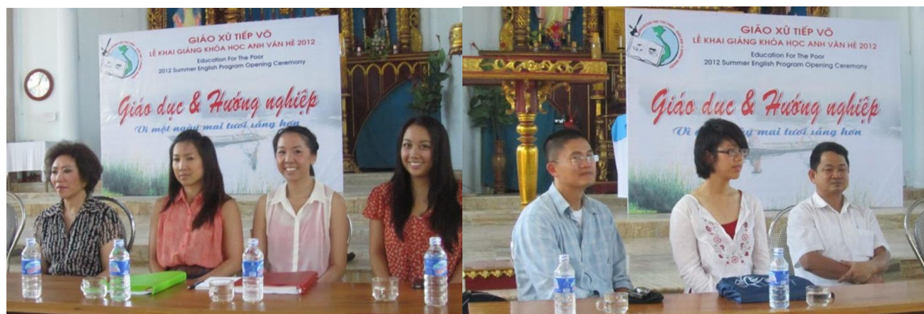
Hình ảnh lễ khai giảng khóa học anh ngữ hè 2012 Giáo xứ Tiếp Võ

Một lần nữa xin trân trọng cảm ơn! Chúc cho quý Hội sẽ tiếp tục có nhiều nghĩa cử cao đẹp, chúc cho các Thầy Cô luôn mạnh khỏe, bình an.